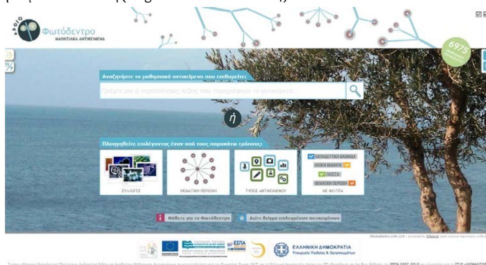
Εικόνα 1: Φωτόδεντρο LOR - Αρχική Σελίδα

Το ΦΩΤΟΔΕΝΤΡΟ > ΜΑΘΗΣΙΑΚΑ ΑΝΤΙΚΕΙΜΕΝΑ (ή Φωτόδεντρο LOR) στη διεύθυνση http://photodentro.edu.gr/lor είναι το πρώτο από τα ψηφιακά αποθετήρια της «οικογένειας» Φωτόδεντρο και αποτελεί το Πανελλήνιο Ψηφιακό Αποθετήριο Μαθησιακών Αντικειμένων για την Πρωτοβάθμια και τη Δευτεροβάθμια εκπαίδευση (Μεγαλού & Kaklamanis 2014).